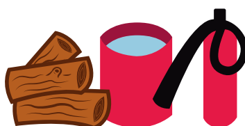
Lenha, água, extintor