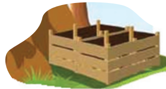
cerca de madeira