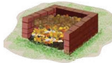
cerca de tijolo